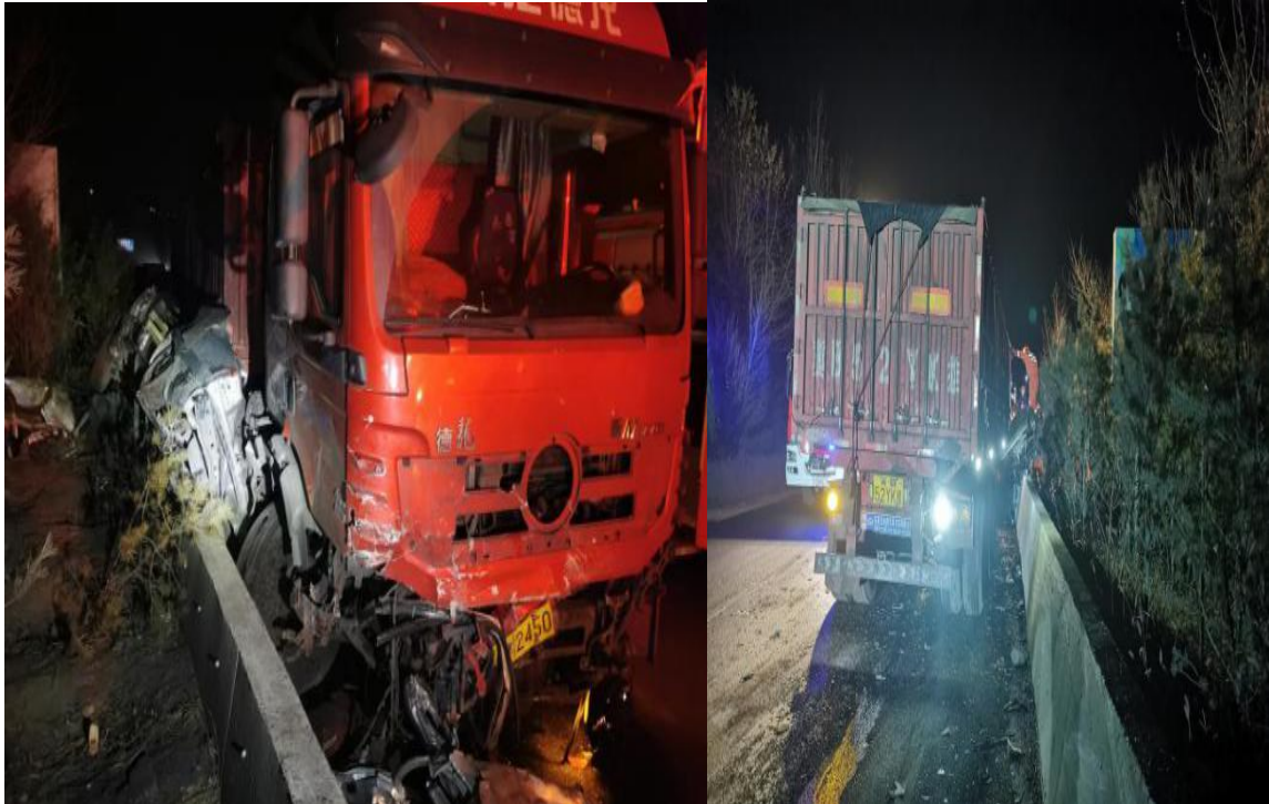
图2 事故现场示意图